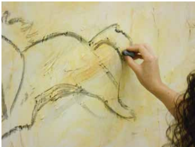
Peinture rupestre en atelier ©Ville de Marseille.

Découvrir l'origine de l'Homme moderne par l'observation et la manipulation de crânes d'Hominidés. Scolaires cycle 2 et 3, Collège - mardi, jeudi et vendredi à 14h. Durée : 45 min par ½ classe - Livrets pédagogiques disponibles