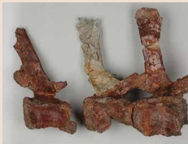
Vertèbre de Rhabdodon.