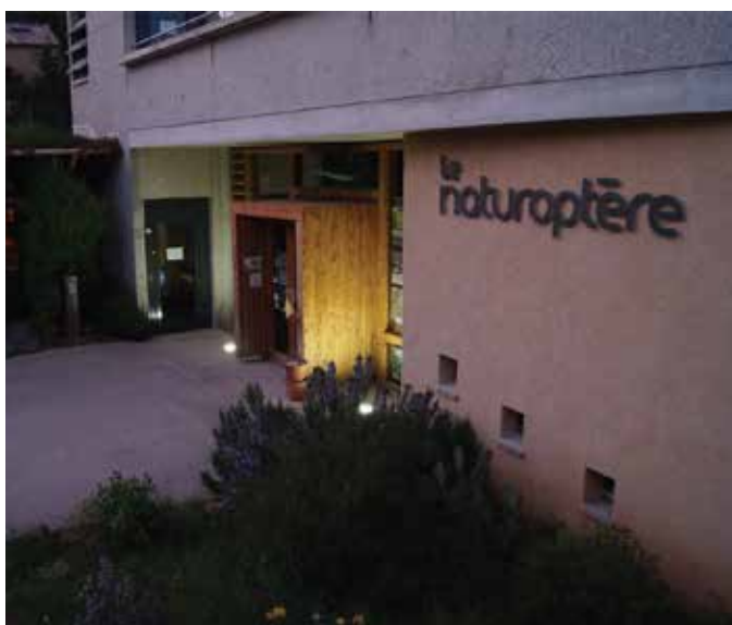
Découverte du Naturoptère, la nuit, avec les Compagnons juniors, © le Naturoptère/JJP/Perret & Farhi.

Les bénévoles viendront ce soir-là pour présenter le ciel visible, les constellations et les autres corps célestes. Cette soirée est un hommage à Jean-Henri Fabre et son intérêt pour l'astronomie. Le 18 novembre (à 5h du matin !) se produira dans le ciel le « pic » de présence des étoiles filantes de l'essaim des Léonides. Animation offerte, mais pensez à réserver au 04.90.30.33.20.