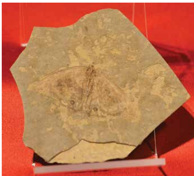
Holotype de Lethe corbieri Nel, Nel & Balme, 1993, Lepidoptera Nymphalidae Satyrinae. Céreste (Alpes-de-Haute-Provence) Parc naturel régional du Luberon, Apt (Vaucluse).

Une vie de scientifique, d'étude et de recherche. Une vie de passionné, inlassablement sur le terrain, soucieux d'établir une collection pour la transmettre, la conserver pour les générations futures. Une vie de patience, tant la préparation d'un spécimen demande de la minutie, de la rigueur. Une vie de rêveur aussi, non dans les nuages, mais dans le sillage du papillon. Et cet être diaphane, si éphémère, collecté avec soin – et respect – va se retrouver ici comme figé dans un instant de vie.