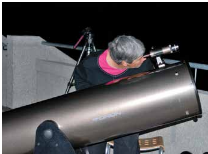
Observation du ciel avec l'association Pesco-Luno, © Pesco-Luno.

Soirée d'astronomie avec l'association Pesco-Luno Mardi 17 novembre, de 20h à 21h30, sur le toit du Naturoptère