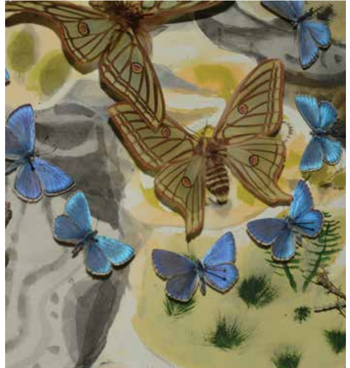
« Les gorges du Verdon » – Dany Lartigue – extrait de l'oeuvre.

Muséum d'histoire naturelle de Toulon et du Var