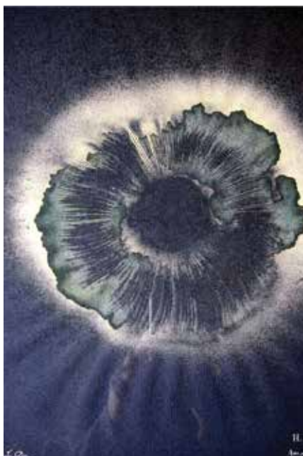
Hélène Le Du présente ses préparations artistiques à base de champignons, © Hélène Le Du.

Adresse : Chemin du Grès, 84830 - Sérignan-du-Comtat