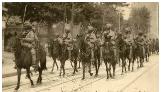
Troupes indiennes