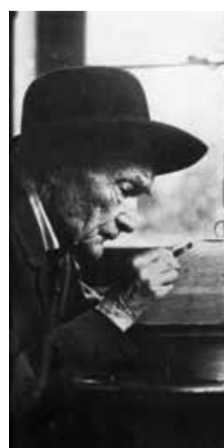
Jean-Henri Fabre © DP.

Coorganisées par Micropolis à Saint-Léons, village natal de Jean-Henri Fabre, l'Université d'Avignon et des Pays de Vaucluse et le Naturoptère.