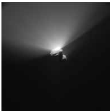
La comète Tchourioumov-Guérassimenko le 22 août 2015, © ESA/Rosetta/NavCam – CC BY-SA IGO 3.0

Conférence organisée par les Amis du Planétarium Peiresc. Entrée libre.