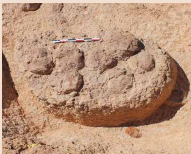
Ponte de dinosaure.