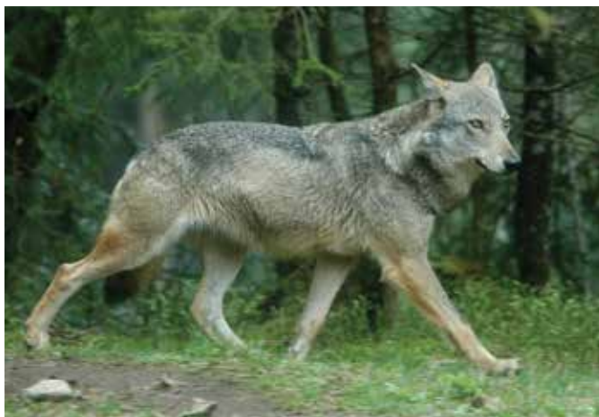
Canis lupus italicus.

Adresse : 67, rue Joseph Vernet, 84000 Avignon